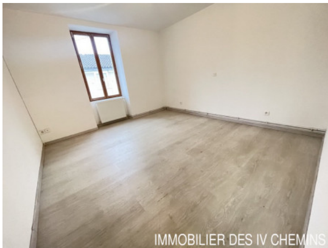
IMMOBILIER DES 4 CHEMINS