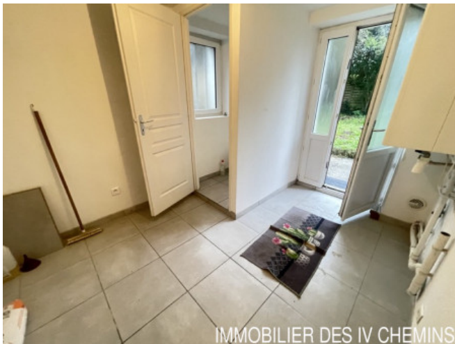
IMMOBILIER DES 4 CHEMINS