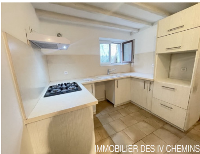
IMMOBILIER DES 4 CHEMINS