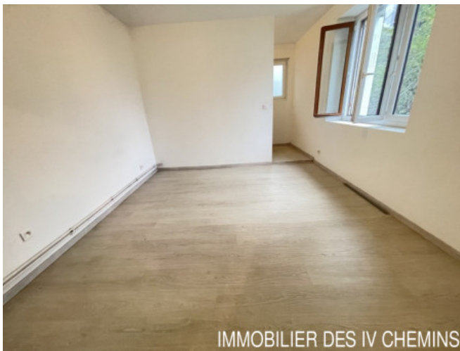
IMMOBILIER DES 4 CHEMINS