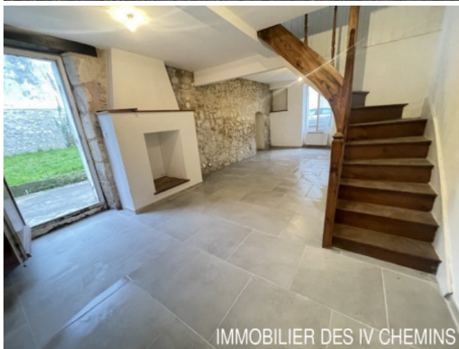
IMMOBILIER DES 4 CHEMINS