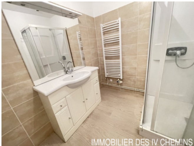
IMMOBILIER DES 4 CHEMINS