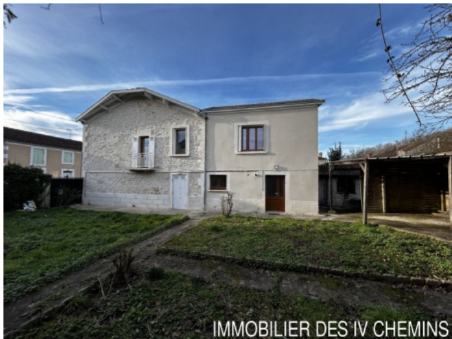
IMMOBILIER DES 4 CHEMINS