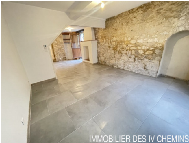
IMMOBILIER DES 4 CHEMINS