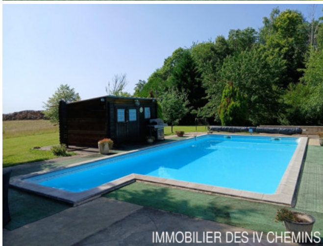
IMMOBILIER DES IV CHEMINS