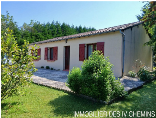
IMMOBILIER DES IV CHEMINS