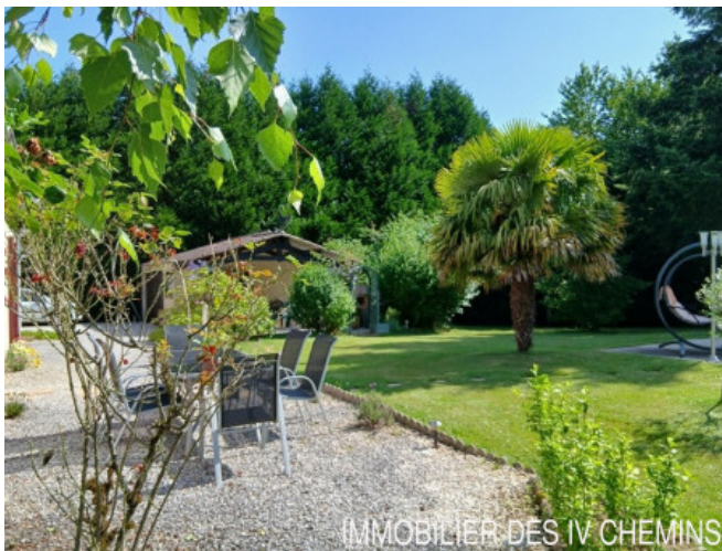
IMMOBILIER DES IV CHEMINS