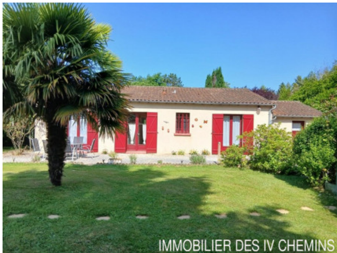
IMMOBILIER DES IV CHEMINS