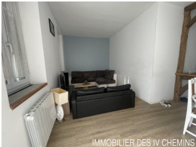
IMMOBILIER DES IV CHEMINS