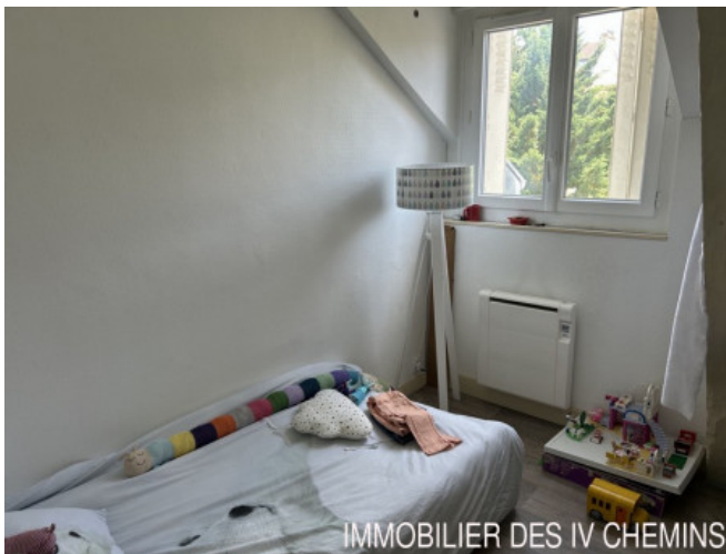
IMMOBILIER DES IV CHEMINS