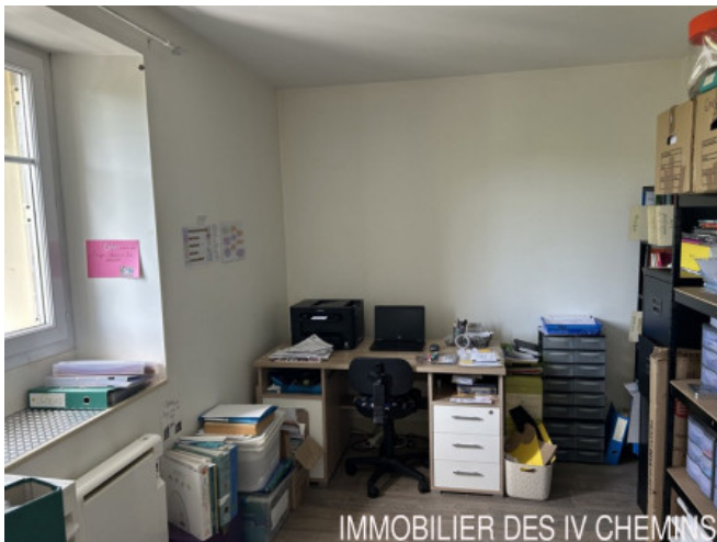
IMMOBILIER DES IV CHEMINS