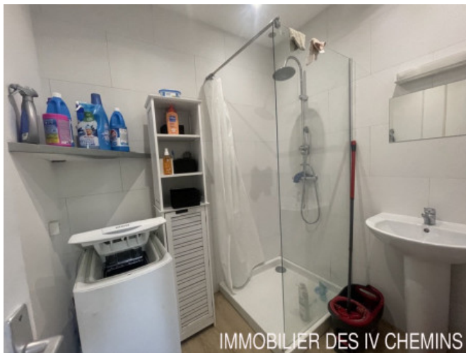
IMMOBILIER DES IV CHEMINS