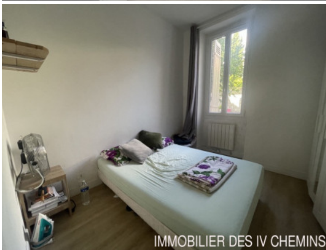
IMMOBILIER DES IV CHEMINS