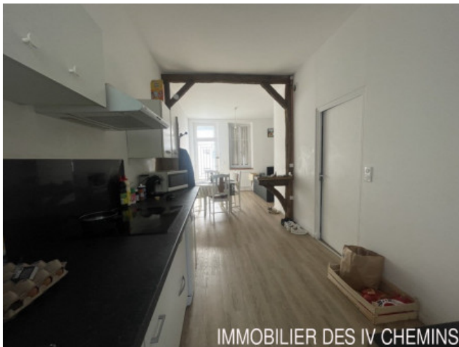
IMMOBILIER DES IV CHEMINS