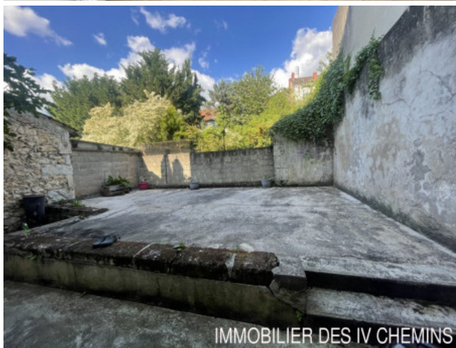
IMMOBILIER DES IV CHEMINS