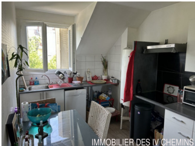
IMMOBILIER DES IV CHEMINS