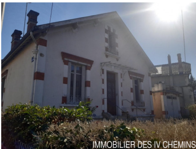
IMMOBILIER DES IV CHEMINS