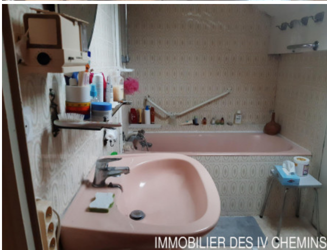
IMMOBILIER DES IV CHEMINS