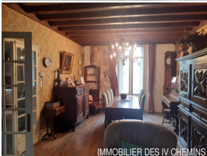
IMMOBILIER DES IV CHEMINS