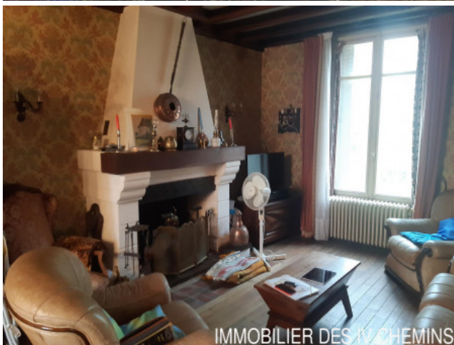
IMMOBILIER DES IV CHEMINS