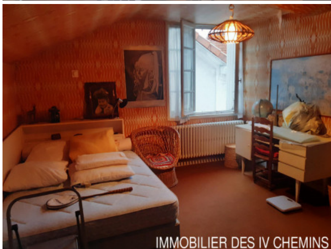
IMMOBILIER DES IV CHEMINS