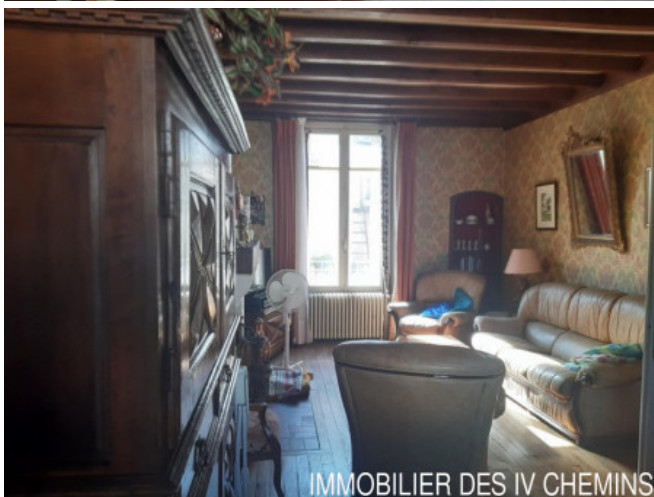
IMMOBILIER DES IV CHEMINS