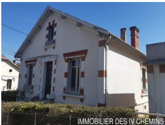
IMMOBILIER DES IV CHEMINS