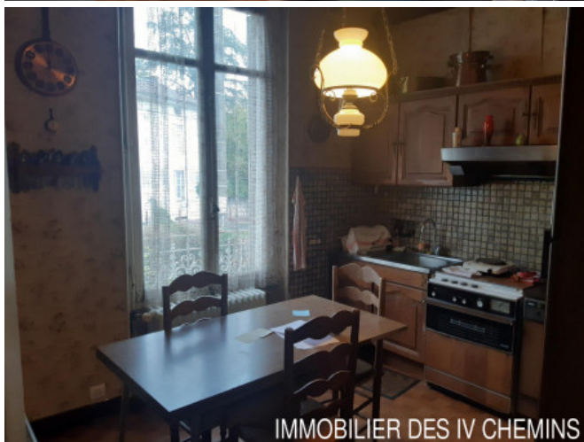
IMMOBILIER DES IV CHEMINS